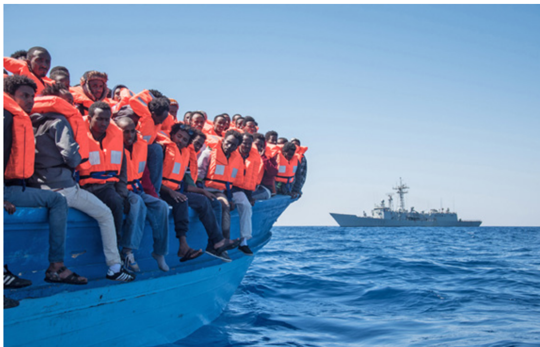
Een Spaans fregat pikt migranten op in de Middellandse Zee