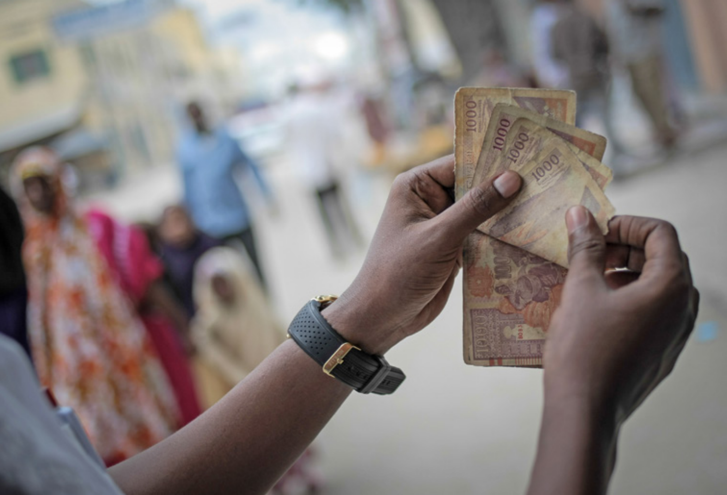
De bedragen die Afrikaanse migranten naar hun herkomstland sturen (remittances) vormen een belangrijke bron van inkomsten, waar vele huishoudens van afhankelijk zijn