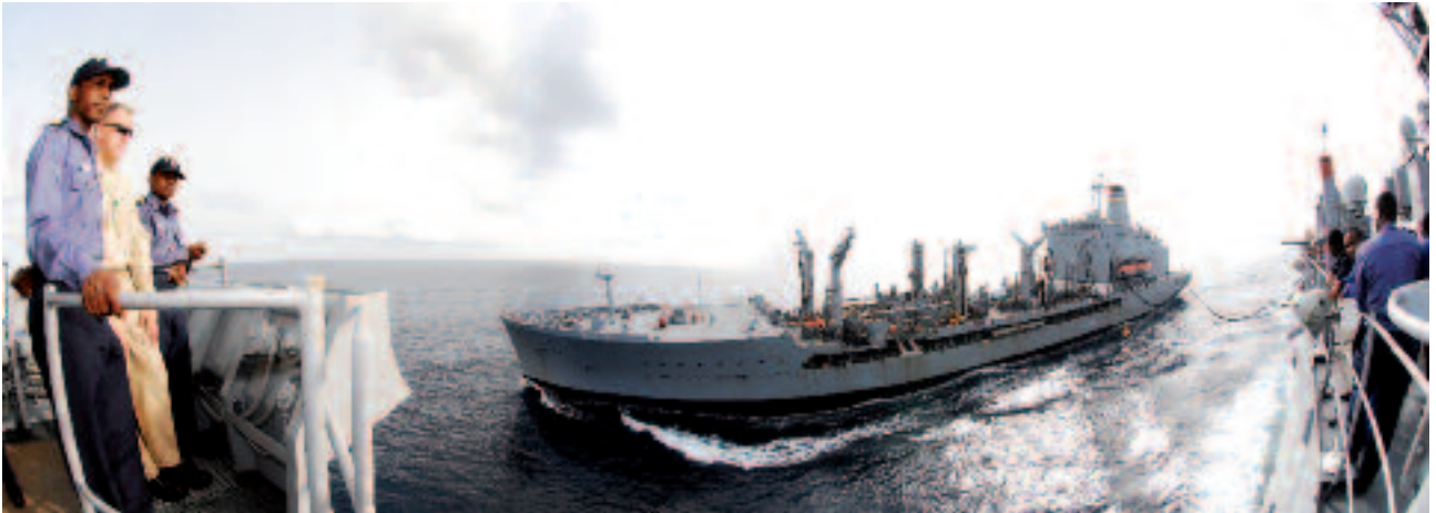
De positie van Nederland als zestiende economische macht ter wereld brengt de verantwoordelijkheid met zich mee om bij te dragen aan de mondiale maritieme veiligheidsarchitectuur

in staat moeten zijn om te allen tijde te voorkomen dat rivaliserende mogendheden SLOCs of maritieme knooppunten kunnen afsluiten. De strategische waarde van onderzeeboten is van cruciaal belang om dit te voorkomen. Aangezien een substantieel deel van het transport op zee op weg is naar Rotterdam en de andere Nederlandse havens, zal ons land naar rato verantwoordelijkheid moeten nemen in de collectieve verdediging. De klassieke militaire taken van afschrikking, dwang en oorlogvoering vergen maritiem-militaire middelen die volledig compatible zijn met bondgenoten, en waarmee Nederland zijn vitale belangen tot in het hoogste geweldsspectrum kan verdedigen.