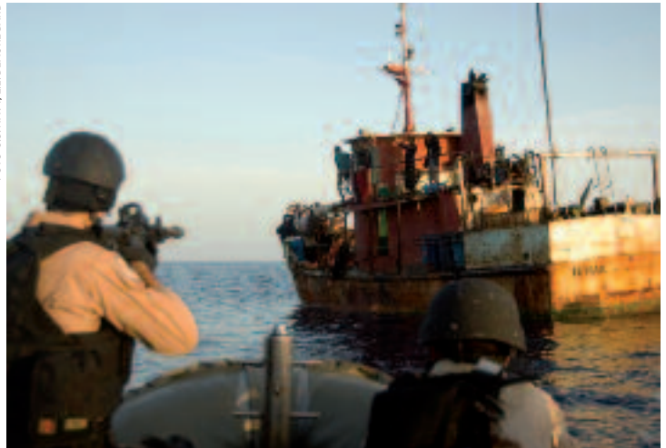
Een Nederlandse maritieme strategie zal niet in 'splendid isolation' tot stand komen

In een strategisch proces wil men uiteindelijk op een logisch wijze middelen laten volgen uit doelstellingen. Vanuit veiligheidsperspectief moet daarvoor eerst duidelijk worden wat de (vitale) belangen zijn die bescherming behoeven. Vervolgens is het van belang welke bedreigingen deze belangen kunnen schaden.