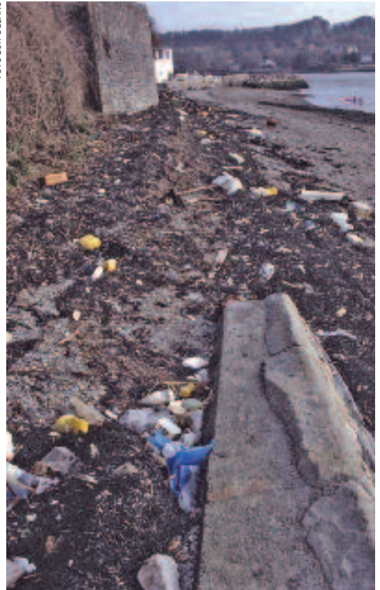
Een van de vitale belangen is ecologische veiligheid

Een nota die voorafging aan de Strategie Nationale Veiligheid (2007), die hierna aan de orde komt, definieert vitale belangen als volgt: