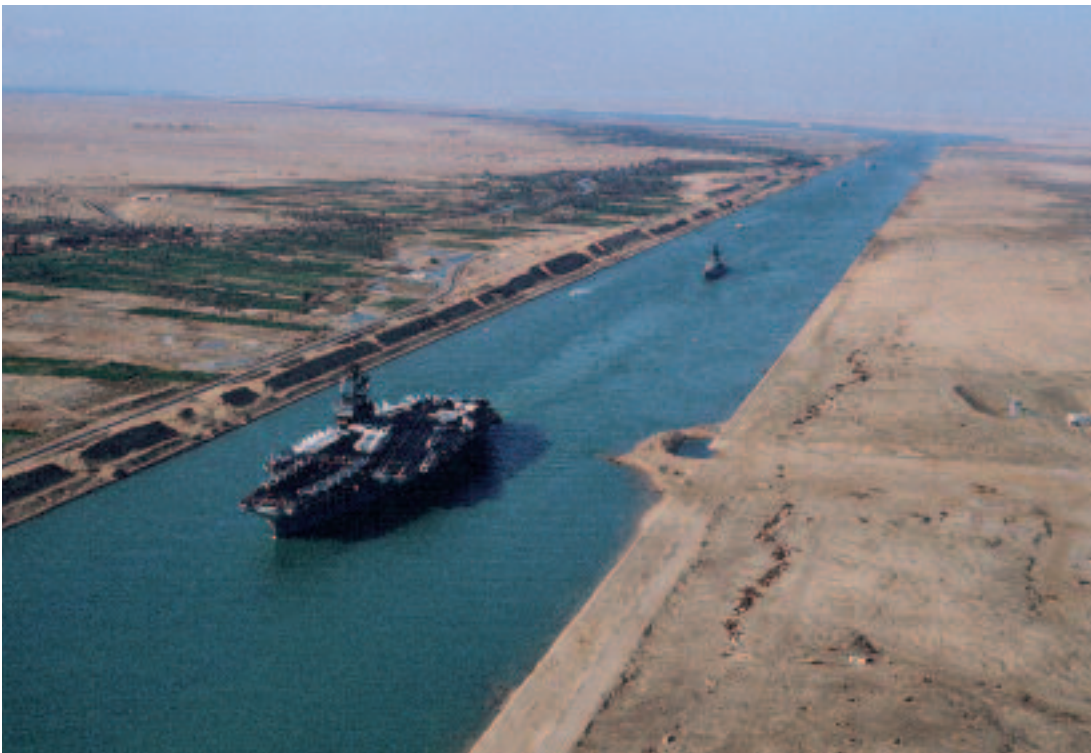
Het Suez-kanaal is een strategische doorvaartroute. Het levert Egypte geld en invloed op, maar is natuurlijk ook kwetsbaar

(KVMO) en de bevelhebber der zeestrijdkrachten (BDZ) in een periode dat hij tussentijds geen Tweede Kamerlid was (1987). Dit verdienstelijke document van 248 bladzijden werd in enkelvoud bewaard en heeft niet kunnen bijdragen aan een brede maritiem-strategische gedachtevorming. 7 De KM publiceerde in 1997 het Operationeel Concept Koninklijke Marine (OCKM), waarin het taakgroepconcept was onderbouwd. Dit document was echter confidantieel gerubriceerd, waardoor het beperkt toegankelijk was.