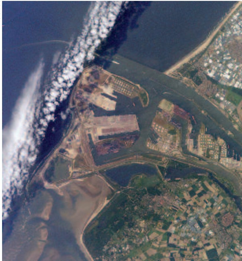
De Rotterdamse haven is veruit de grootste haven in Europa

Het Koninkrijk der Nederlanden heeft een relatief klein oppervlak maar neemt wel een belangrijke economische en een prominente