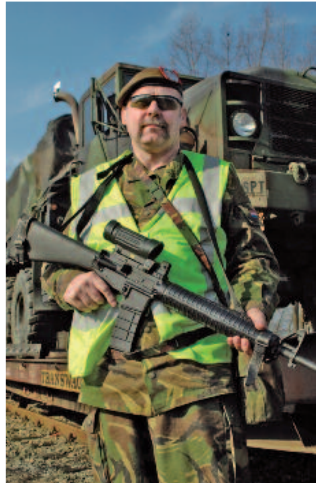
Een Nederlandse reservist bewaakt treinen met Amerikaans materieel in de haven van Rotterdam (2003)

Door toenemende dreigingen en afnemende middelen ontstaat een veiligheidswig in het maritieme domein. Voor free rider gedrag, waarbij bondgenoten meeliften op de veiligheidsinspanningen van de Verenigde Staten, zal steeds minder ruimte zijn, aangezien de US Navy, die onder president Reagan nog uit 600 schepen bestond, inmiddels tot 275 schepen is gekrompen. 40 De positie van Nederland brengt taken met zich mee die volgen uit de bedreigingen van vitale maritieme belangen.