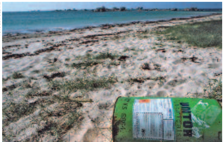
Chemische vervuiling. Sinds kort is er meer aandacht voor vervuiling van de wereldzeeën

een oppervlak ter grootte van de VS. Het plastic leidt tot de dood van duizenden vogels en komt door desintegratie uiteindelijk in de voedselketen terecht. 38