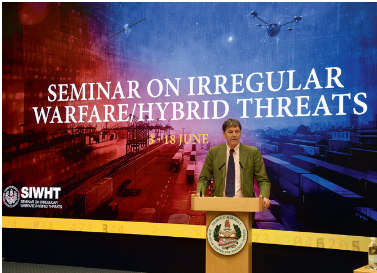
Wetenschappers voeren al een tijd een debat over het begrip hybride oorlog, waarbij gray zone warfare het nieuwste buzzword is