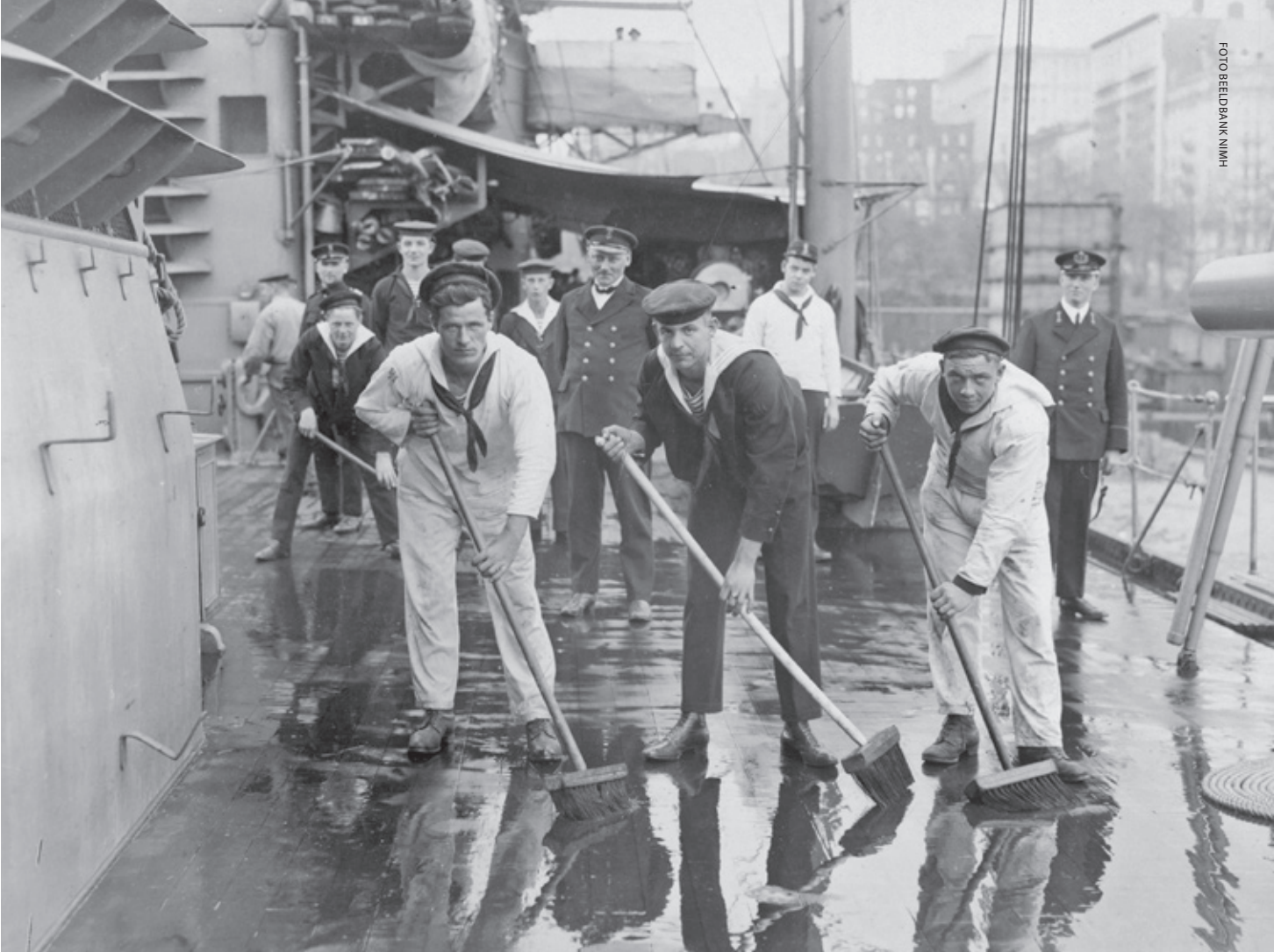
Dekzwabberen aan boord van Hr.Ms. Sumatra in New York, 1926. Militaire geschiedenis kan niet alleen over grote namen en grote daden gaan en dient anno nu een multidisciplinair vakgebied te zijn

oorlog te legitimeren. Sinds januari 2025 heeft ook de Amerikaanse regering zich in dat rijtje geschaard, getuige de executive orders om boeken uit bibliotheken te verwijderen, de verdiensten van zwarte en vrouwelijke militairen uit te wissen, onderzoeksprogramma's en zelfs opleidingen te schrappen, simpelweg omdat hun bestaan de nieuwe machthebbers onwelgevallig is. Ook in Nederland zijn er politici die die verleiding niet kunnen weerstaan. Het huidige tijdsgewricht stelt ons ook in dit opzicht voor uitdagingen waarvan we, wellicht naïef, na 1945 hadden gehoopt dat we ze niet meer zouden hoeven te overwinnen.