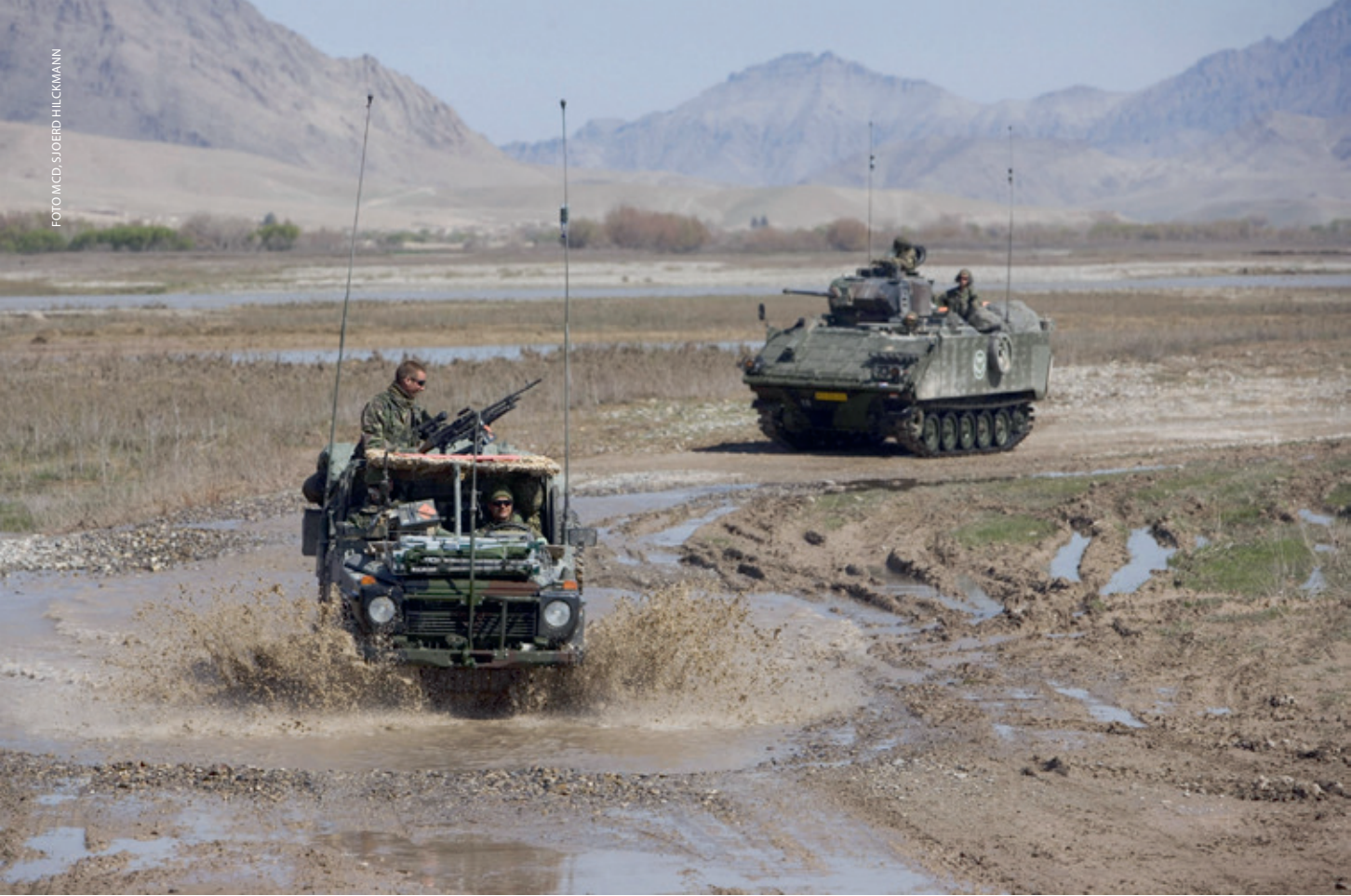
Optreden van Nederlandse militairen bij Deh Rawod in Uruzgan, 2007. Militair historici mogen geen hapklare lessen beloven waar militairen in de praktijk niets aan hebben

natie te belichten. Zo zou de militair historicus zich verre dienen te houden van conclusies die veteranen of het aanzien van de krijgsmacht zouden kunnen schaden. Veteranen zijn in deze lezing door politieke besluitvorming in situaties gebracht waarin ze zich ook maar hadden te redden; eigenlijk zijn zij slachtoffers, of mensen die alleen maar hun plicht deden en dus boven kritiek verheven zijn. Historici, zoals mijn collega's van het Nederlands Instituut voor Militaire Historie die participeerden in het ODGOI-project over de oorlog tegen Indonesië en