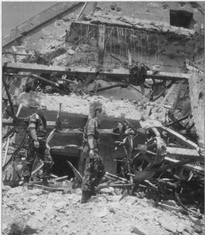
Kosovo – door kruisraketten van de NAVO vernielde communicatiebunker

Naast de onomstreden uitzonderingen van interstatelijk geweldgebruik die onder het regime van LDP-II (gevechtsoperaties) vallen, volgen de – in meer of mindere mate – omstreden vormen van interstatelijk militair optreden. Enkele van deze vormen worden als operationele taken in LDP-III (vredesoperaties) beschreven.