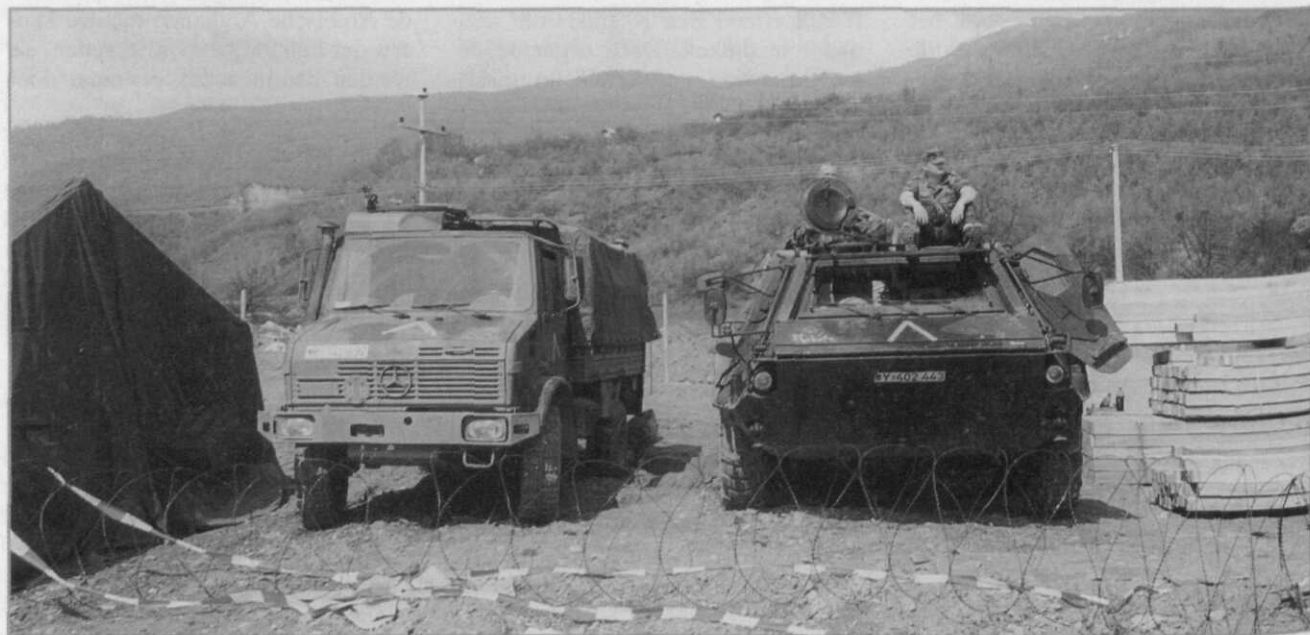
Mede door het NAVO-ingrijpen in Macedonië werden al-Qaeda-extremisten daar tijdig de pas afgesneden

Ook in Albanië en Kosovo hadden zich al-Qaeda-cellen gevormd. De