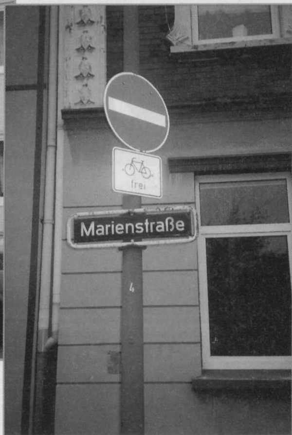
In de Hamburgse Marienstrasse vormde zich in 1999 een al-Qaeda-cel rond Mohammed Atta

actualiteitenrubriek Netwerk meldde dat een groep Egyptenaren in 1997 van plan was de Amerikaanse ambassade in Tirana op te blazen, een operatie die in Netwerk met al-Qaeda in verband werd gebracht. 15