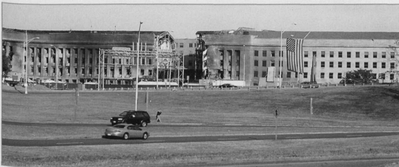
Het verwoeste deel van het Pentagon

Na het uitbreken van de oorlog in Bosnië in het voorjaar van 1992 roken de Arabische Afghanen nieuwe kansen om hun strijd voort te zetten. Ze werden daarin actief gesteund door