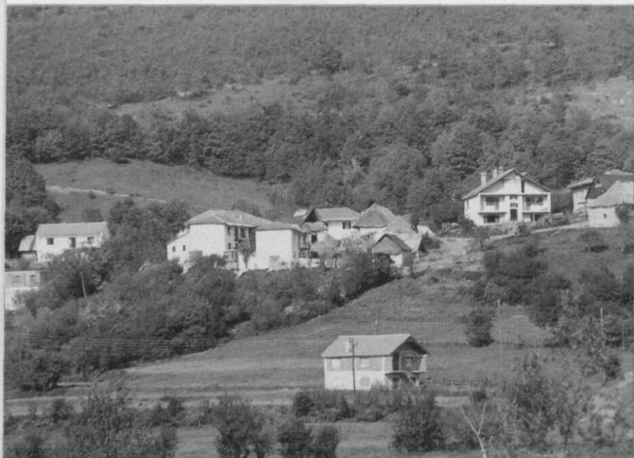
Dorp in Kosovo

Iran, dat ook een contingent strijders naar Bosnië stuurde. De betrekkingen tussen Sarajevo en Teheran waren uitstekend. De Arabische en Iraanse strijders verwierven zich op het slagveld een reputatie van uitzonderlijke wreedheid. Ze maakten officieel deel