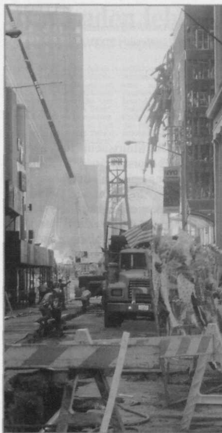
'Ground Zero', New York