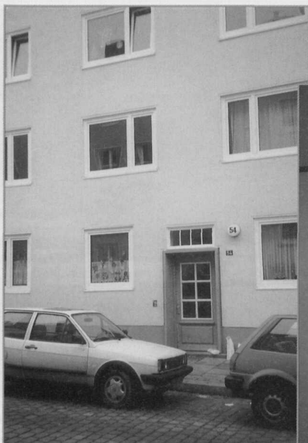
De flat van Mohammed Atta in de Hamburgse Mariastrasse: eerste etage links