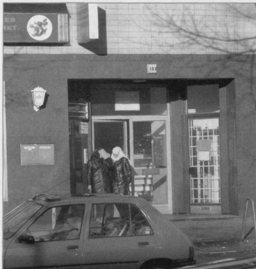
De onopvallende ingang van de al-Quds moskee in Hamburg: trefpunt van de Hamburgse al-Qaeda-cel

David keerde begin 1999 terug naar Frankrijk waar hij werd gearresteerd. Hij werd verdacht van mogelijke betrokkenheid bij de aanslagen op de Amerikaanse ambassades in Kenia en