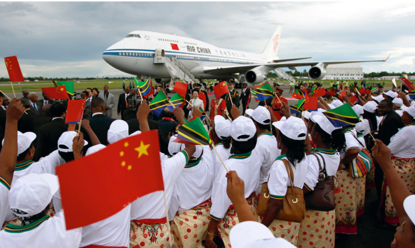
Xi Jinping arriveert in Tanzania. China heeft de economische banden met Afrika sterk uitgebreid en is inmiddels de grootste handelspartner van het continent. Dit roept vragen op 71