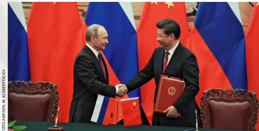
De Russische president Vladimir Poetin en zijn Chinese ambtgenoot Xi Jinping ontmoeten elkaar in Beijing op 25 juni 2016. Rusland en China worden beide in verband gebracht met hybride oorlogvoering

Het begrip leek op zijn retour, maar met de Russische inval op de Krim was het onderwerp hybride oorlogvoering ineens weer actueel. De toenmalige militaire commandant van de NAVO, generaal Philip Breedlove, noemde de Russische hybride dreiging de grootste dreiging voor de NAVO. Volgens hem moest het Westen zich er op voorbereiden en zijn strategie er op aanpassen. 1 Tijdens de Baltische conferentie Who's Afraid of Hybrid Warfare? op 24 september 2015 benoemde ook de voormalig minister van Defensie in haar keynote speech hybride dreiging als één van de twee grootste dreigingen waartegen het Westen zich moet wapenen. 2 Instanties als Clingendael en de Adviesraad Internationale Vraagstukken (AIV) sloten zich hierbij aan. 3,4 Hoewel het alweer even geleden is en diverse organisaties en instanties inmiddels de conclusie hebben getrokken dat hybride oorlogvoering niet nieuw is, lijkt een duidelijk antwoord nog niet gevonden. 5 Wel zijn velen het erover eens dat de Russische inval op de Krim een andere verschijningsvorm had dan voorgaande conflicten. Bovendien komt in het geval van Rusland de dreiging dichtbij en dus leeft het onderwerp. Een land in opkomst dat ook in verband gebracht wordt met hybride oorlogvoering, is China. 6 Eerdere studies bevelen aan om China als casus van hybride oorlogvoering te bestuderen. Deze aanbevelingen vormen de aanleiding van dit artikel. 7