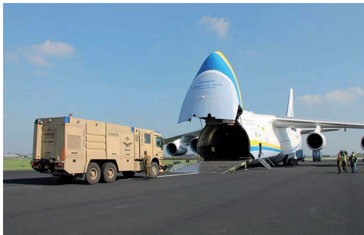
Om de grote hoeveelheden materiaal snel naar de vliegbasis in het Midden-Oosten te krijgen wordt onder meer een Antonov An-124 voor strategisch luchttransport in gehuurd

politieke besluitvorming heeft plaatsgevonden. Het Nederlandse team werkt daarom in Florida onder het principe van prudent planning , waarbij meegedacht wordt over mogelijke inzet van de Nederlandse krijgsmacht onder voorbehoud van een politieke opdracht. Deze vroege betrokkenheid van Nederlandse planners bij de operatie blijkt later van onschatbare waarde voor het snel inzetten van het eerste detachement in het Midden-Oosten.