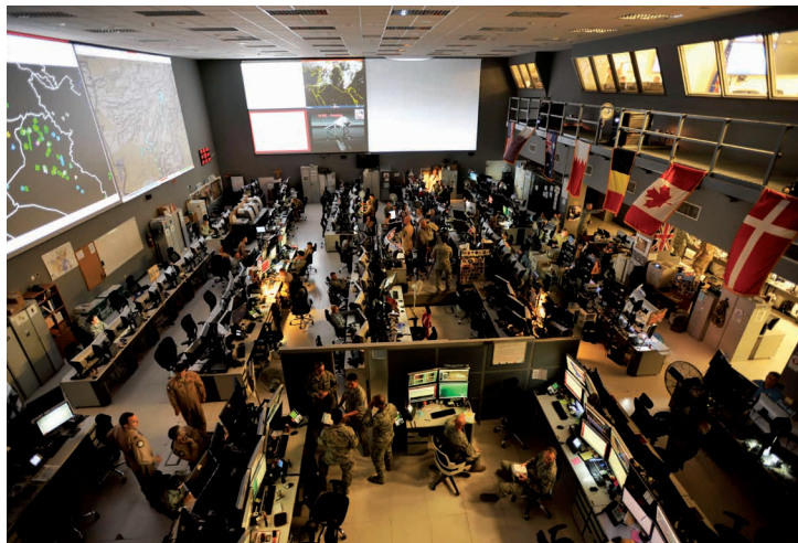
Het Combined Air Operations Center (CAOC) Al Udeid, Qatar, waar de luchtoperaties in Irak en Syrië worden gecoördineerd

uitvalsbasis om daar met het gastland de nodige afspraken te maken. Hiervoor is al cruciaal voorwerk gedaan door de ambassade en in het bijzonder de Defensie-attaché in de regio. De eerste overleggen leiden dan ook snel tot resultaat. Het gastland is bereid tot samenwerking en stelt een vliegbasis voor mede gebruik beschikbaar. Dit vliegveld, op 45 minuten vliegen van de Iraakse grens, is een bare base locatie, waar alle benodigde voorzieningen zelf ingevlogen en opgebouwd moeten worden. Het opereren vanaf een bare base brengt een scala aan uitdagingen met zich mee. In dit geval moest letterlijk alles zelf geregeld worden, van de sanitaire voorzieningen tot en met de operationele informatievoorziening. Dit zorgde voor extra druk op het detachement om de door de minister gestelde tijdlijn te halen en deed een groot beroep op de creativiteit en can do -mentaliteit van het personeel.