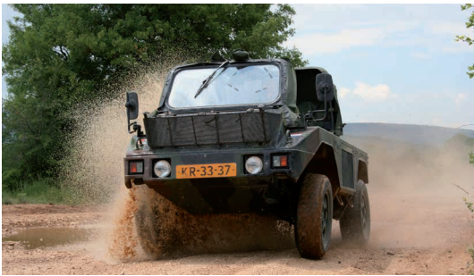
Het luchtmobiel speciaal voertuig (LSV) waarover de brigade beschikt wordt liefkozend Playmobiel genoemd

Ook de bewapening werd aangepast en gemoderniseerd, en sinds 1998 beschikt de brigade over een zogeheten luchtmobiel speciaal voertuig (LSV), liefkozend 'Playmobiel' genoemd.