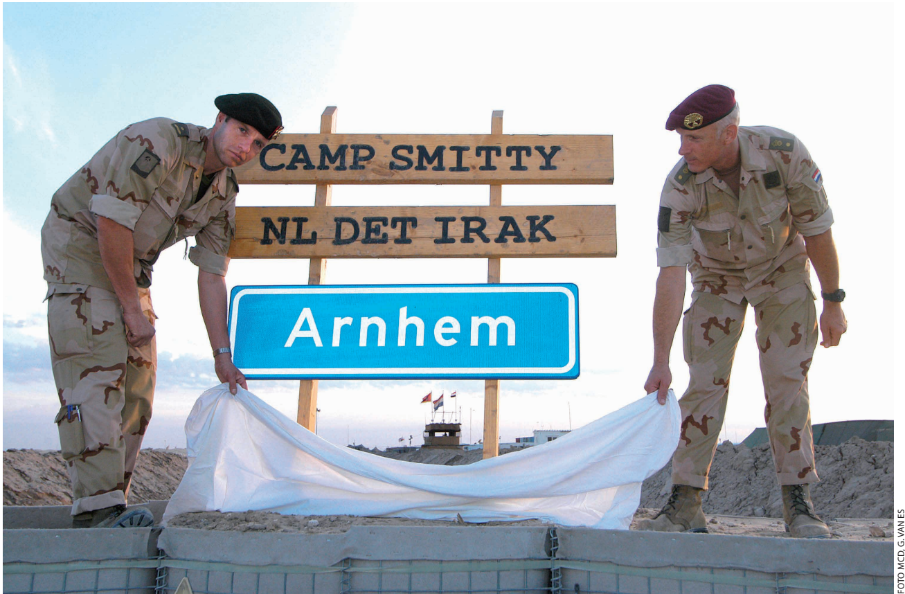
Onthulling van het bord van de gemeente Arnhem in As Samawah, Irak, november 2004

veiligheidseenheden én tegelijkertijd mee te werken aan de reconstructie van het gebied in de provincie Al-Muthanna. 28 Al vanaf juli 2003 nam Nederland deel aan SFIR, te beginnen met eenheden van het Korps Mariniers, een geniecompagnie, een veldhospitaal en een helikopterdetachement met allereerst Chinooks en later ook Cougars en Apaches.