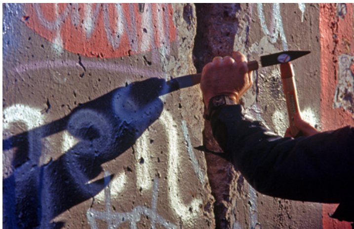
Pas na de val van de Berlijnse Muur ebde de angst voor een Sovjetaanval weg en stay-behind-netwerken werden daarmee overbodig

In Nederland bestond de stay-behind-organisatie Inlichtingen en Operatiën (I&O) die verantwoordelijk was voor het plegen van verzet door enerzijds inlichtingen te verzamelen en anderzijds (kleinschalige) sabotage te plegen en de bevolking moreel weerbaar te maken tegen communistische invloeden. 5 Deze activiteiten zouden plaatsvinden na de bezetting van Nederlands grondgebied. Zowel de opbouw van conventionele en nucleaire verdediging tegen de dreiging van het Warschaupact als het opzetten van stay-behind-netwerken kunnen worden begrepen als wordt gekeken naar de alom