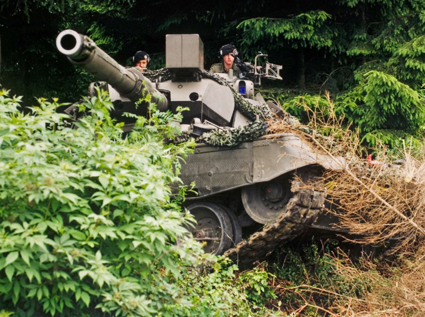
Een conventionele aanval zou kunnen worden opgevangen door de Rijn-IJssellinie en vanaf 1955 door de verdedigingslijnen in Duitsland, waar ook Nederlandse militairen oefenden