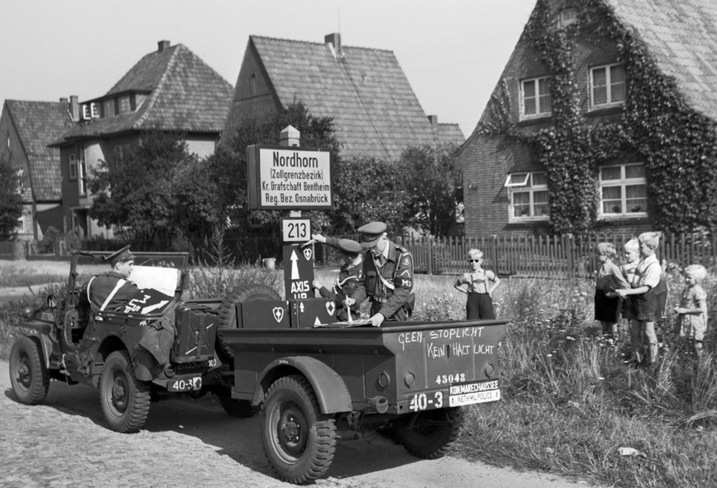
Nederlandse militairen op oefening in Duitsland. Aanvankelijk werd Nederland als operatiegebied beschouwd in geval van een Sovjetaanval, later schoof de verdedigingslinie oostwaarts op