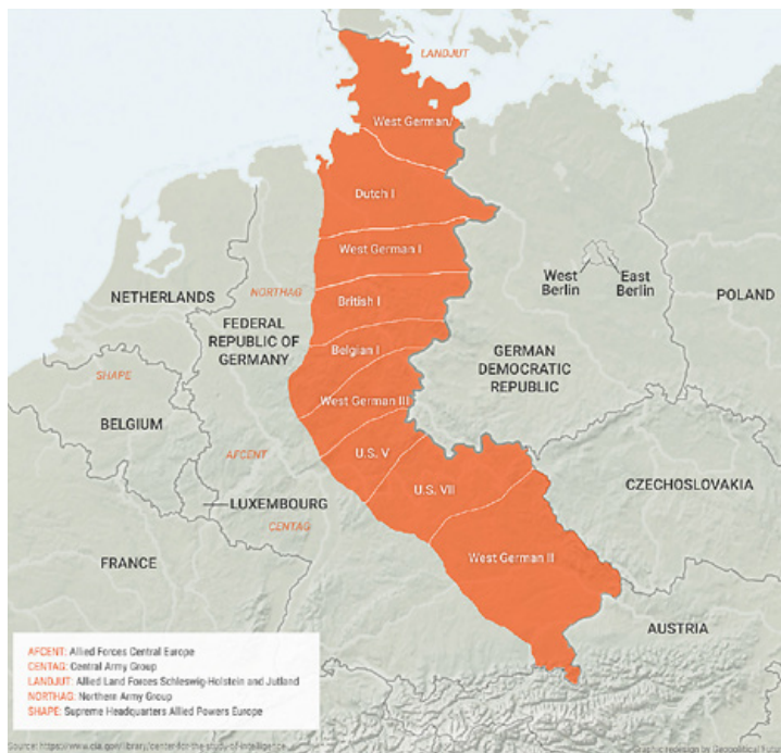
Figuur 2 Een overzicht van de verdeling van de gebiedsverantwoordelijkheid van NAVO-bondgenoten in West-Duitsland vanaf 1966, beginnend aan de Elbe. Het Nederlandse 1LK maakt hier deel uit van de Northern Army Group (NORTHAG) en dient samen te werken met de West-Duitsers op de beide flanken

voorwaartse verdediging. 45 Hierop werd het nut van de verdedigingslinie in heroverweging genomen, waarop het besluit viel de linie in 1964 op te heffen en af te breken, wat in 1968 was voltooid. 46