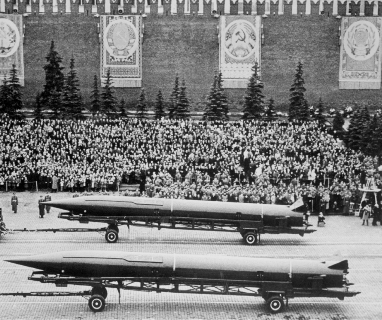
Het opzetten van stay-behind-netwerken is begrijpelijk als wordt gekeken naar de angst die heerste voor de 'rode springvloed': angst voor bezetting door de Sovjet-Unie

een aanval tegen hen allen. 4 Het opbouwen van een krijgsmacht die zich tegen een mogelijke conventionele invasie door het Warschaupact (al dan niet gesteund met nucleaire middelen) teweer kon stellen was hierbij van het grootste belang. Er waren echter ook Europese beleidsmakers bij die een stap verder dachten. Zij troffen op eigen initiatief voorbereidingen op het ergst mogelijke: een communistische bezetting van West-Europa. Hiertoe zetten nationale overheden stay-behind-netwerken op, die hun in staat zouden stellen zich te weren tegen het communisme, zelfs als de NAVO-troepen in Europa verslagen zouden zijn. De nationale verzetswerken werden verenigd binnen de NAVO.