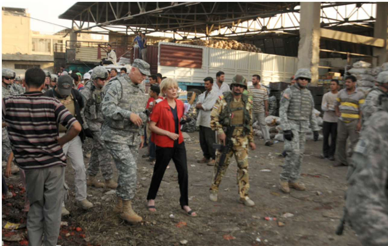
De bekende Amerikaanse journalist Lesley Stahl in Bagdad tijdens de Golfoorlog: de media zijn in oorlogsverslaggeving ingeklemd tussen de fog of war en een veelheid aan informatie

dat Rusland van plan was een nepvideo te maken om de invasie van Oekraïne te rechtvaardigen. Lee vroeg om bewijs, maar dat kon of wilde Price niet geven.