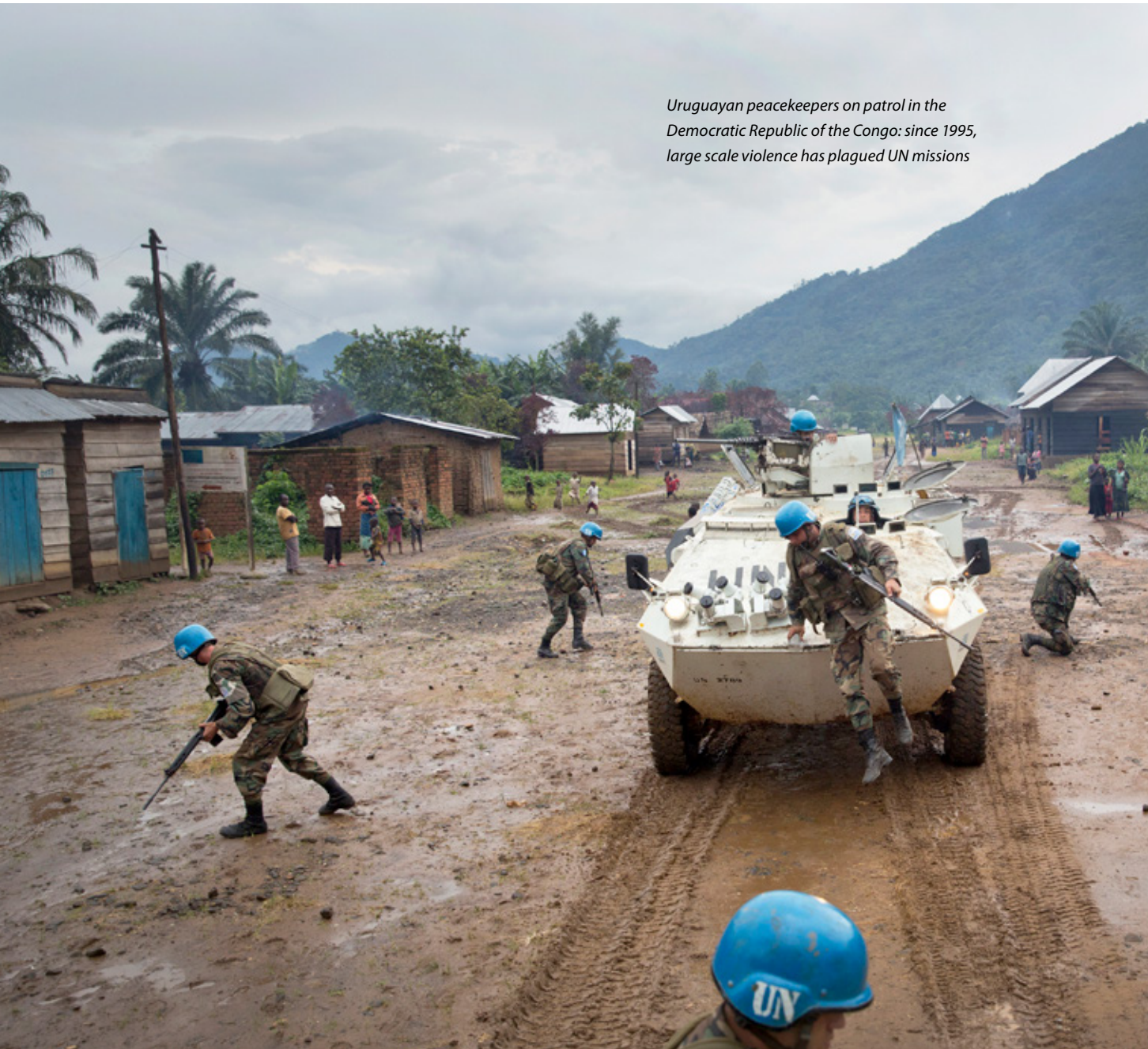
Uruguayan peacekeepers on patrol in the Democratic Republic of the Congo: since 1995, large scale violence has plagued UN missions

...we choose to operationalize mission success by scoring two variables:...whether large-scale violence is brought to an end while the implementers are present; and whether the war is terminated on a self-enforcing basis so