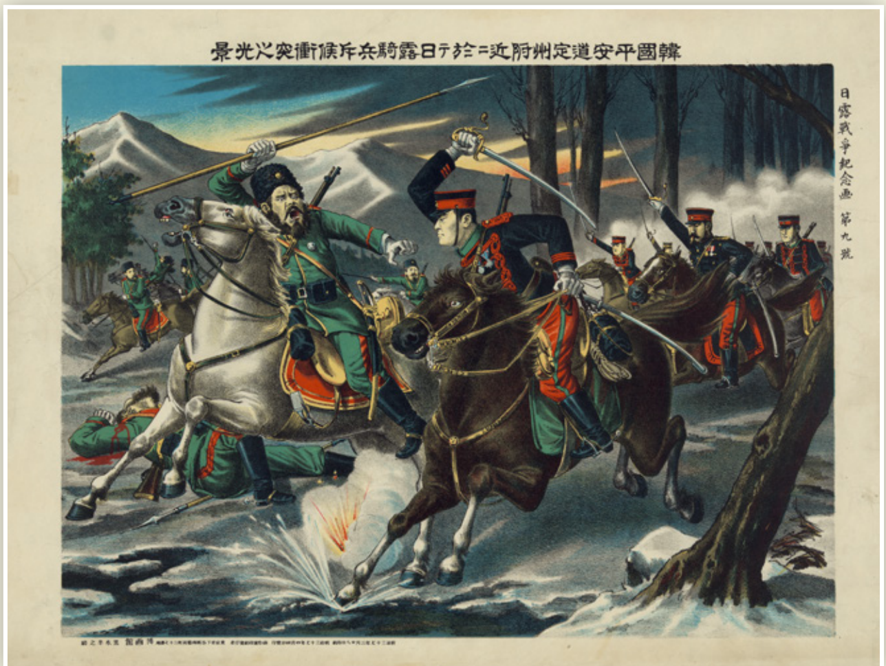
Japanse en Russische cavalerietroepen treffen elkaar tijdens de Russisch-Japanse oorlog (1904-1905)

gische wetenschap’. 1 Die kennis was er al eerder: ‘Reeds in den Russisch-Japanschen oorlog, doch vooral tijdens den wereldoorlog zijn de Generale Staven der oorlogvoerende mogendheden steeds meer tot de erkenning gekomen’ van dat inzicht.