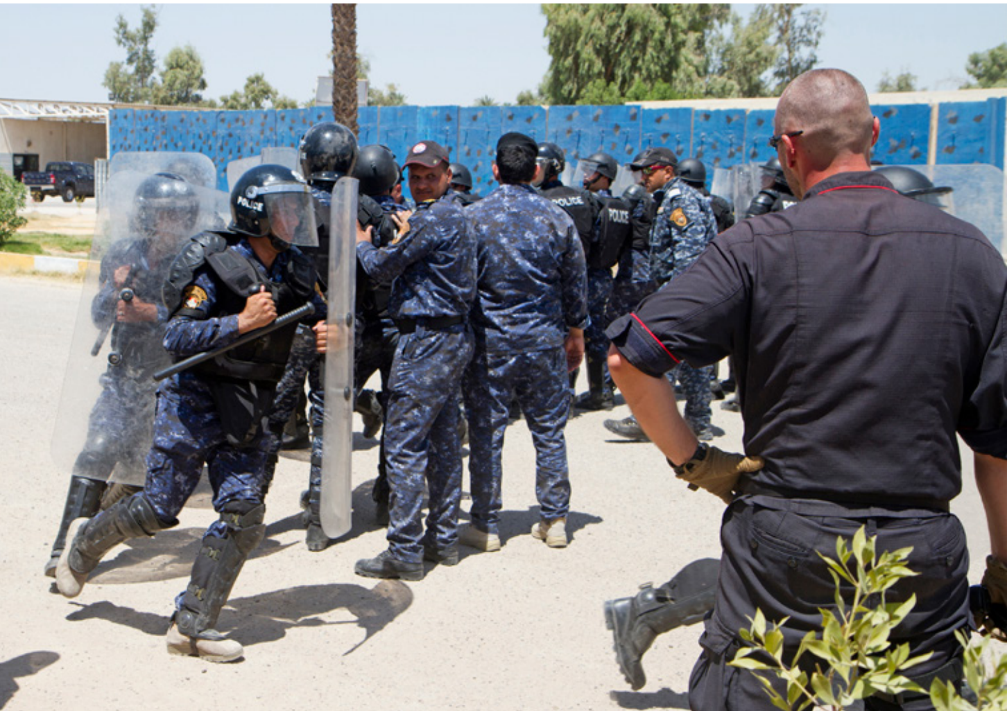
An Italian Carabinieri trainer observes as Iraqi Federal Police officers run to set up a riot control formation during a training exercise at Camp Dublin in Baghdad, 2016