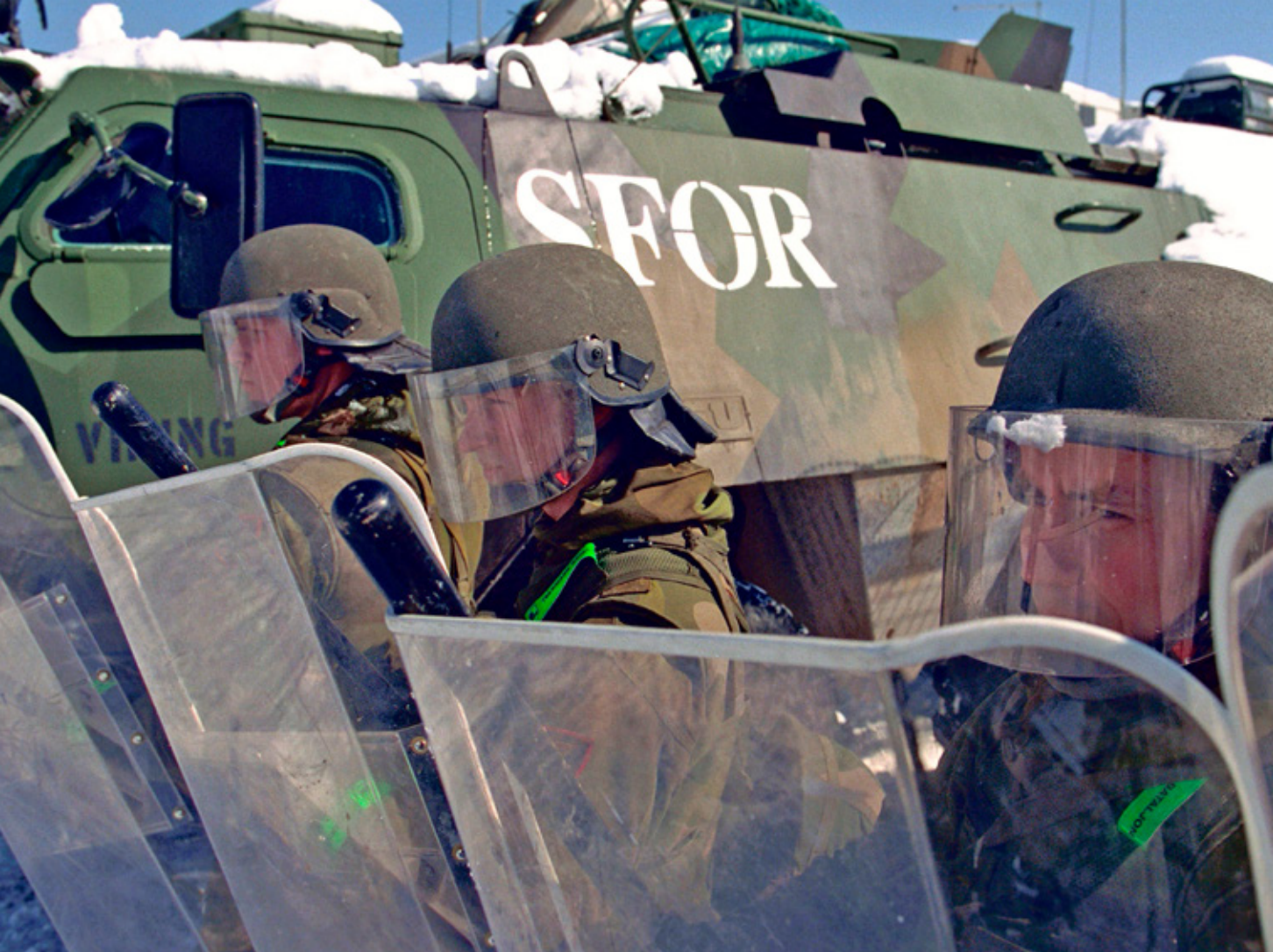
In Bosnia, a Multinational Specialized Unit was eventually deployed to correct the lack of a crowd and riot control capacity within IFOR'S force posture