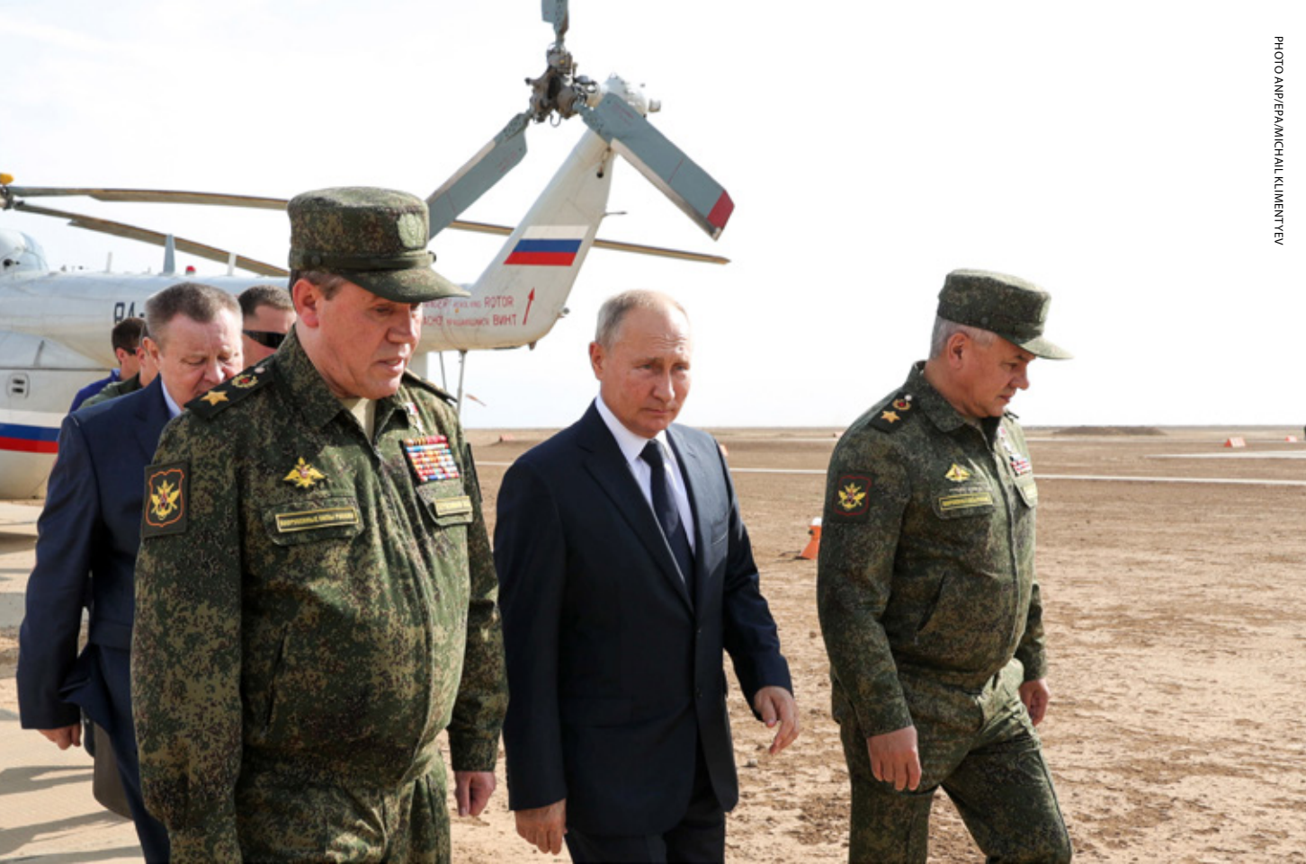
Russian Defence Minister Sergei Shoigu (R), President Vladimir Putin (2-R) and First Deputy Defence Minister and Chief of the General Staff of the Russian Armed Forces Valery Gerasimov (front L); in some form of self-inflicted maskirovka , western security and defence analysts were led to read Gerasimov's article as a blue-print for a new form of Russian warfare

article was a call to members of the Russian military-academic community to help stimulate the development of military science in order to address these issues. Because most importantly, Gerasimov stated, the essence of military science is to help foresee and thus prepare for the unique characteristics and conditions of any particular possible future conflict. Thus it was not the revelation of a fixed template or a new military doctrine and it certainly did not lie at the basis of Russian operations in Crimea and Eastern Ukraine, which at the time still had to take place one year later. If the article could tell us anything it must be that according to Gerasimov at that time Russia was perhaps lagging somewhat behind in certain areas.