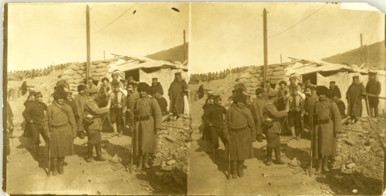
Een stereofoto van Russische militairen die zichzelf en hun stelling overgeven aan de Japanners

‘Zoo heeft zich langzamerhand een “militaire” Geologie ontwikkeld, welke zich bezig houdt met de praktische toepassing der geologische kennis van den bodem op de militaire techniek in vredes- en oorlogstijd.’