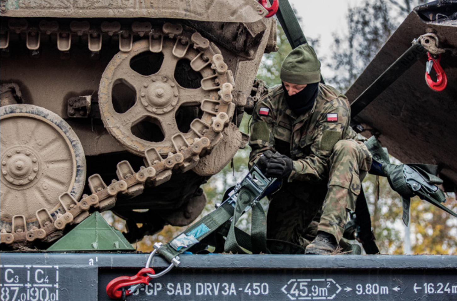
Een Poolse militair laadt pantservoertuigen op een trein. Militaire mobiliteit in Europa is een belangrijk thema voor zowel EU als NAVO, waarbij landen van beide organisaties inmiddels samenwerken