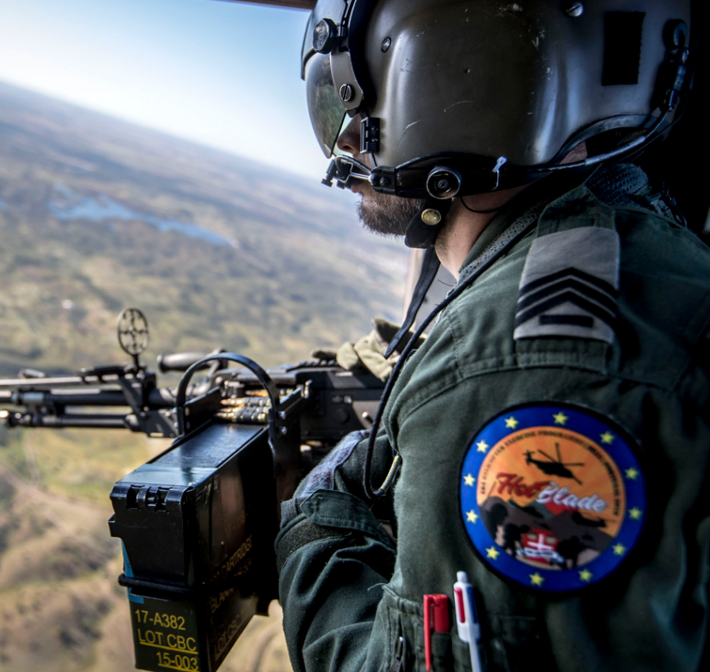
Nederlandse deelname aan de jaarlijkse oefening Hot Blade van het Europees Defensie Agentschap (EDA). Activiteiten van het EDA moeten het EU-veiligheids- en defensiebeleid verder operationaliseren

Een gezamenlijke Europese politieke strategie ontbrak nog en daarom volgde in 2003 de eerste Europese Veiligheidsstrategie, getiteld: 'Een veilig Europa in een betere wereld'. Het doel van deze strategie was de Europese veiligheidsbelangen te behartigen door het EU-gedachtegoed van good governance en democratie wereldwijd te 'exporteren'. Tot slot werd met het Europees Defensie Agentschap (EDA) ingezet op harmonisatie en ontwikkeling van militaire capaciteiten om het EU-veiligheids- en defensie-