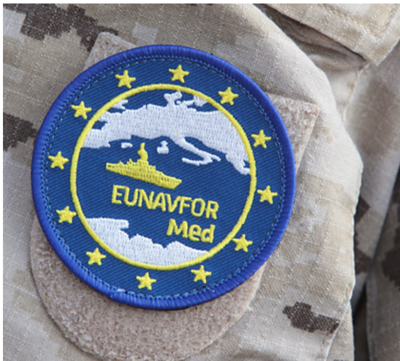
De NAVO en de EU werken operationeel steeds meer samen, zoals in de Middellandse Zee met NAVO-operatie Sea Guardian en EUNAVFOR MED (operatie Sophia)

ijke structuren, operaties en capaciteiten van de EU. 38